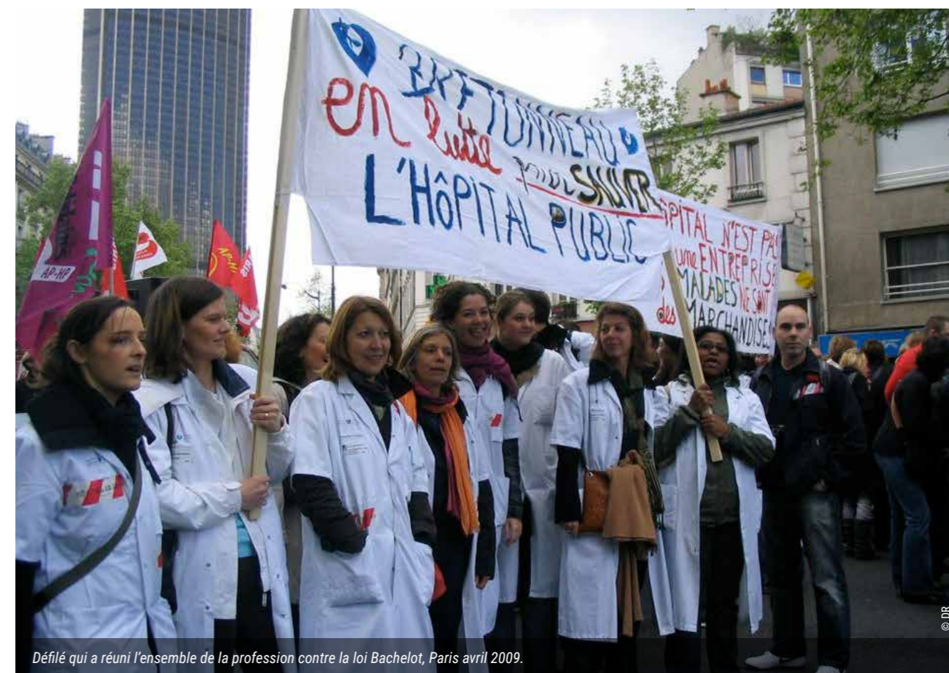
Défilé qui a réuni l'ensemble de la profession contre la loi Bachelot, Paris avril 2009.

Faire de l'augmentation des salaires (y compris en ce qui concerne leur part socialisée au travers des cotisations sociales) et de l'arrêt d'une politique économique entretenant un chômage de masse des priorités. Cela permettrait de régler les déficits conjoncturels de la protection sociale, de réduire les inégalités, d'augmenter le pouvoir d'achat non contraint et enfin d'assurer la cohésion sociale.