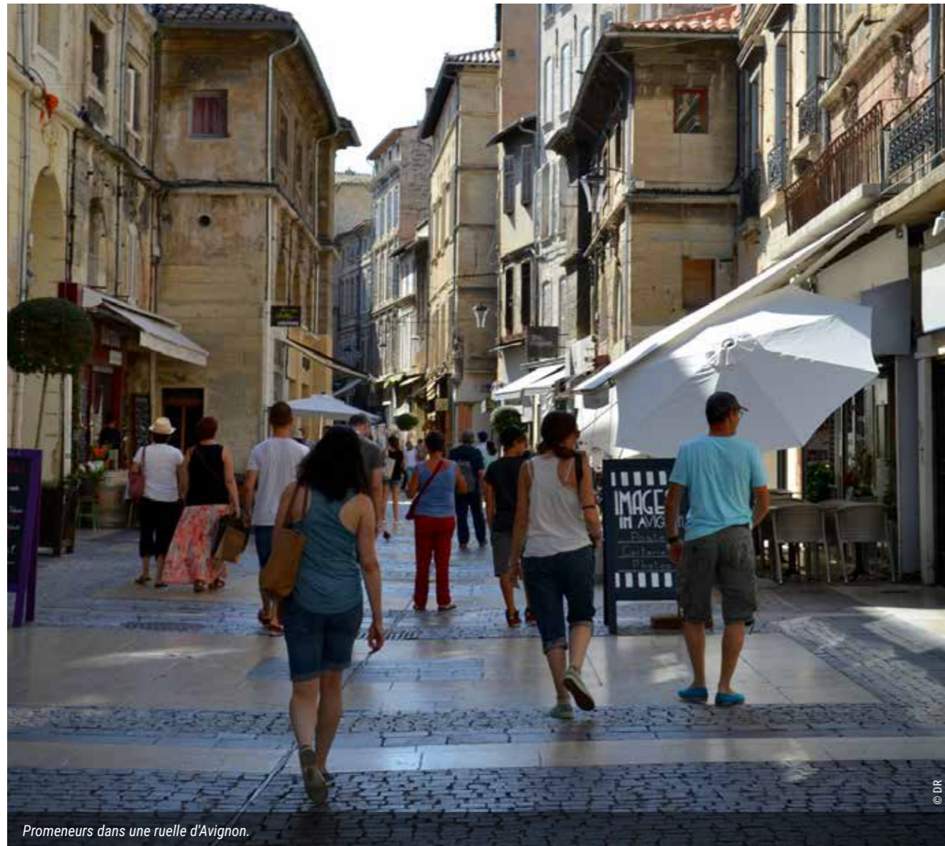
Promeneurs dans une ruelle d'Avignon.

Arrêter le recours au financement privé, avec à la clé une politique fiscale avantageuse dispendieuse pour le budget de l'État, au profit d'une politique publique d'investissement financée par un grand emprunt national pour la construction de logements.