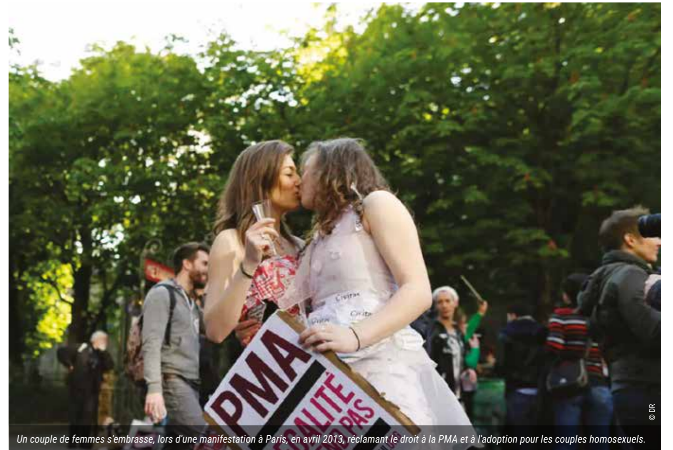
Un couple de femmes s'embrasse, lors d'une manifestation à Paris, en avril 2013, réclamant le droit à la PMA et à l'adoption pour les couples homosexuels.

L'UFAL défend une conception sociale de la famille, ce qui passe par la reconnaissance de toutes les familles sans exclusive.