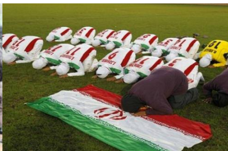
et après la révolution islamique.