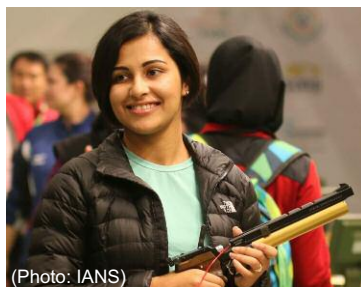
New Delhi: Heena Sidhu during 10m air pistol event at the Asian Olympic Qualifying Tournament in New Delhi, on Jan 27, 2016.

● Heena Sidhu, l'Indienne médaillée d'or de tir à air comprimé , boycotte les championnats asiatiques de Téhéran : " Obliger une sportive à porter le hijab est contraire à l'esprit du sport" (WITW, 10.31.2016)