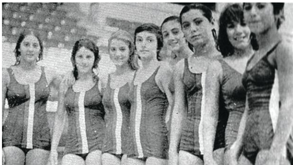
Nageuses Iraniennes avant ...