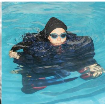
et après la révolution islamique.