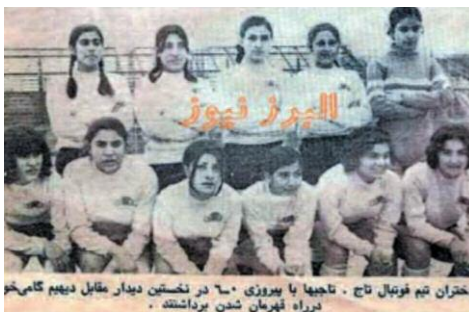
Footballeuses Iraniennes avant...