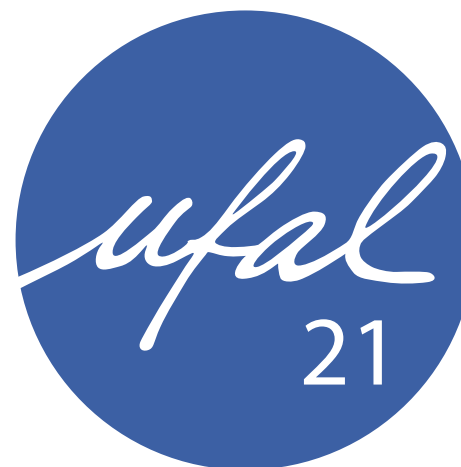
version utilisée pour les supports web

Le logo de l'UFAL est uniquement décliné pour les UFAL départementales. S'il s'agit d'un support de communication d'une UFAL locale, il est possible de le préciser en tête de document.