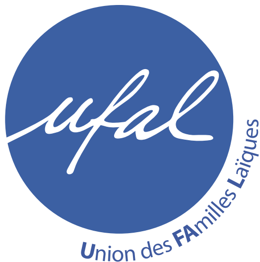
Version utilisée pour les supports papier