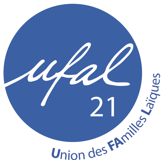
Version utilisée pour les supports papier